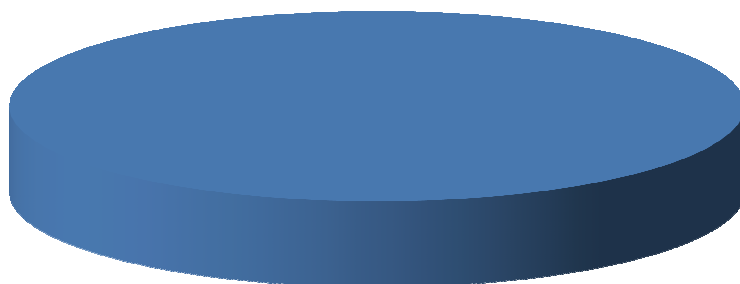
Analisi Entrate per Tipologia (Anno 2017)